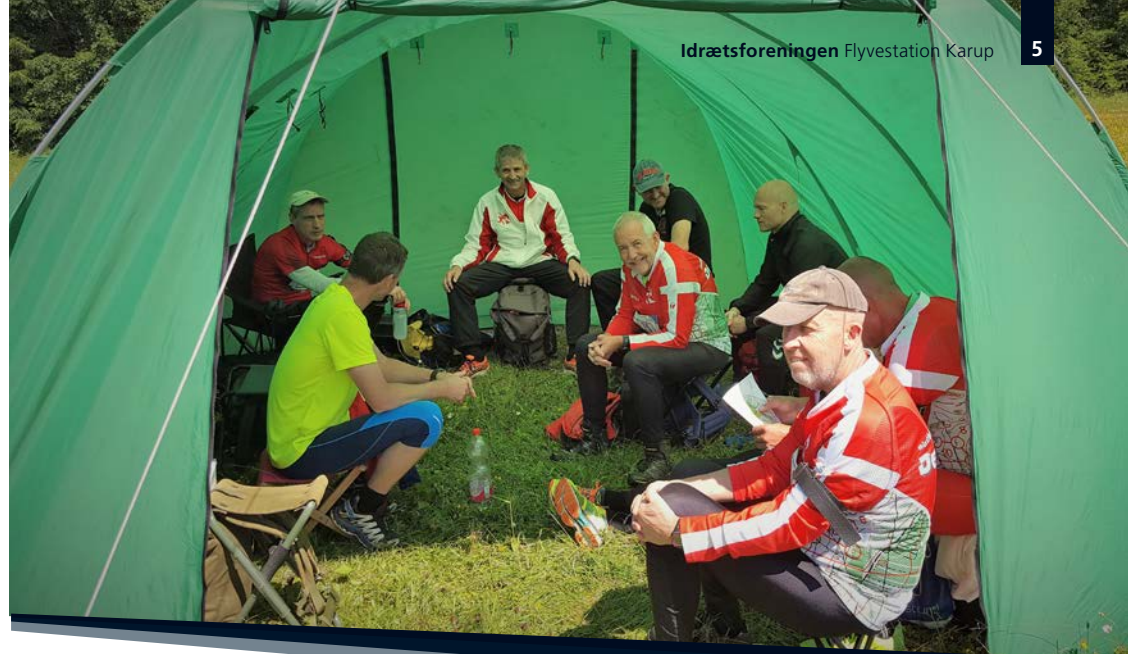
Telt med IFK-ere

Skydningen består af 10 liggende og 10 stående skud, og kun i denne konkurrence tillægges to minutter pr. manglende træf i stedet for strafunder.