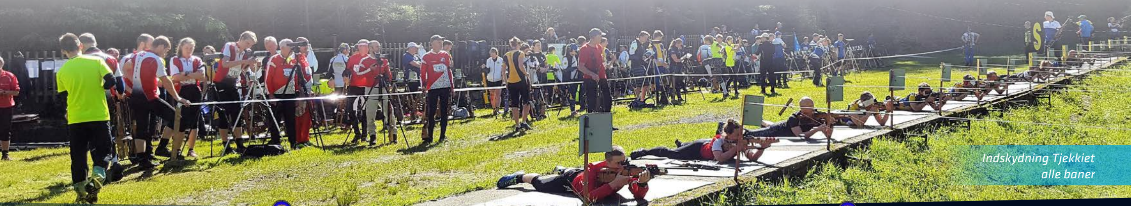
Indskydning Tjekkiet alle baner

Der løbes med samlet start i de enkelte klasser. Alt efter klasse skal der løbes en, to eller tre kortere orienteringsbaner med henholdsvis liggende og stående skydning ►►