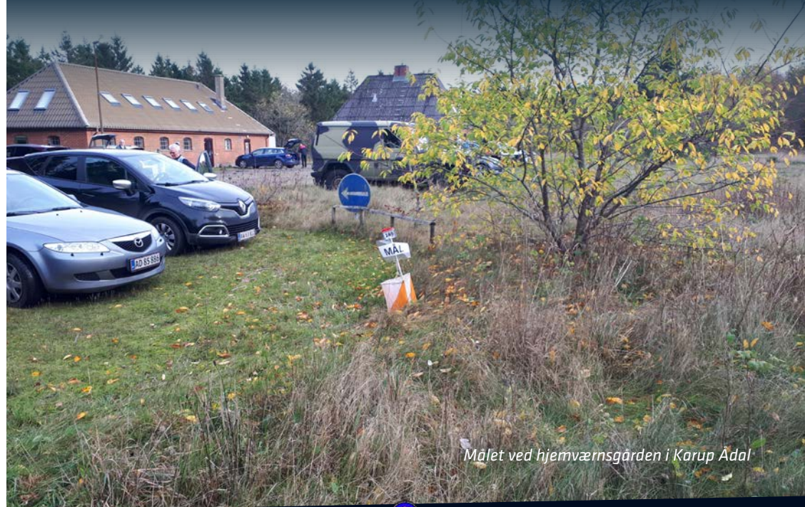
Målet ved hjemværnsgården i Karup Ådal

Hver tirsdag bliver der lavet 3 baner med forskellige længder og varierende sværhedsgrad. Normalt er der en lang bane på 7-8 km, en mellem bane på 5-6 km og en kort ▶▶